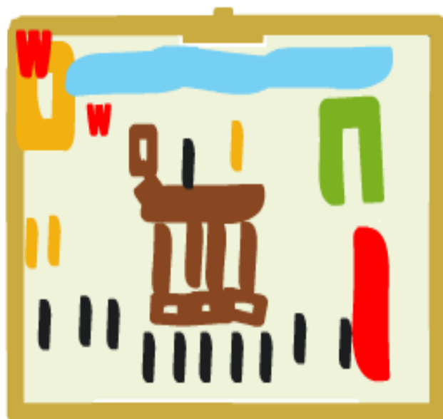
TROYAKO ZALDIA ETA GERLA